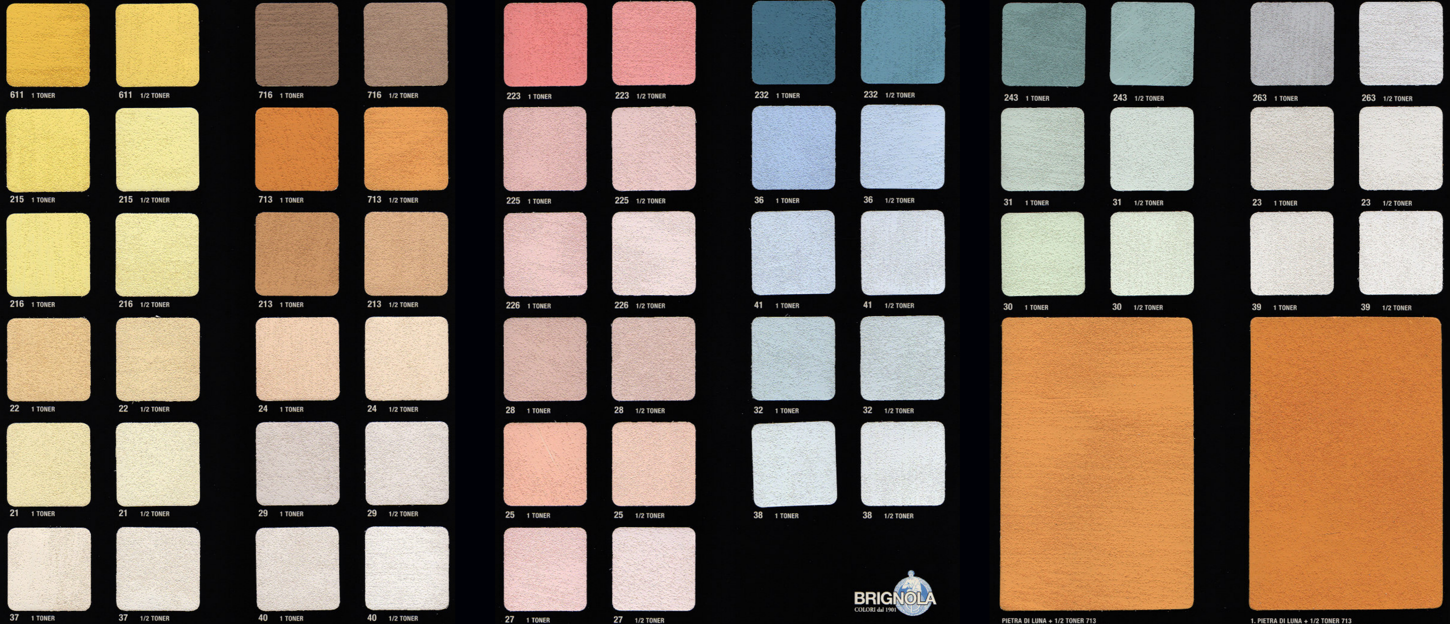
PIETRA DI LUNA + 1/2 TONER 713